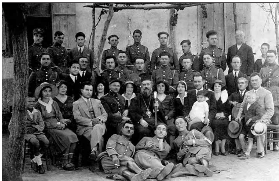
Αναμνηστική φωτογραφία από το Πάσχα του 1932 στην αστυνομία της Νιγρίτας. Στη μέση ο τελευταίος Μητροπολίτης Νιγρίτας Ευγένιος.