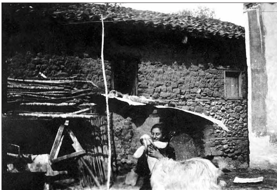
Αγροτική ζωή στη Νιγρίτα. (1940)