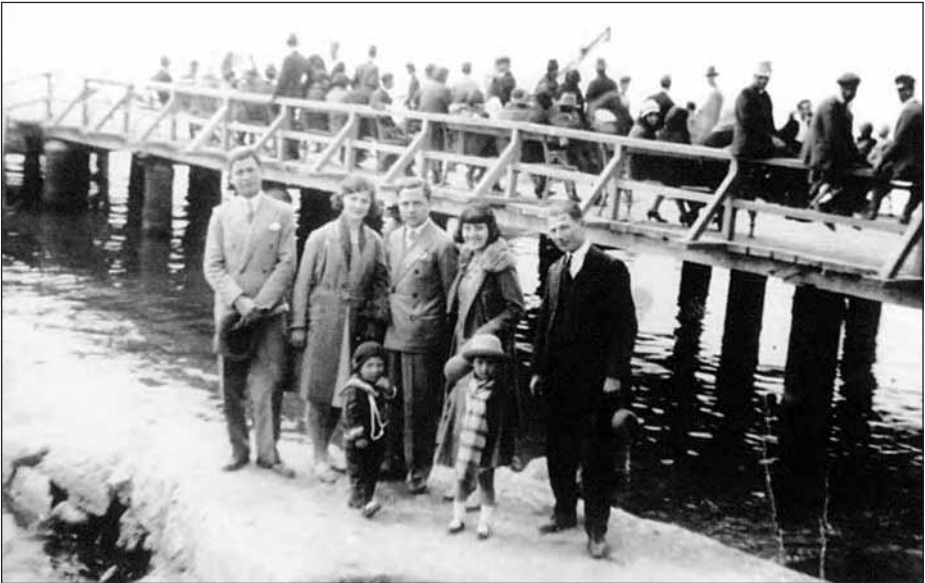
Η ξύλινη γέφυρα στο ποτάμι που χώριζε τη Νιγρίτα από τη Σούρπα.