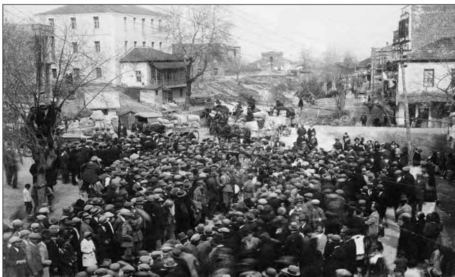
Διαδήλωση καπνοπαραγωγών στις 10-02-1932 στην κεντρική πλατεία της Νιγρίτας.