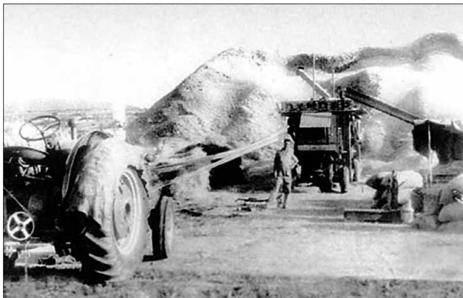
Αλώνισμα με πατόζα στη Νιγρίτα.