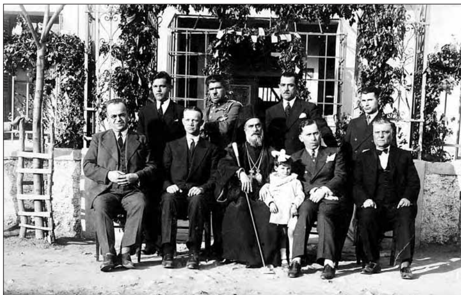
Αναμνηστική φωτογραφία επετείου 25 ης Μαρτίου. Στη μέση ο Μητροπολίτης Ευγένιος. (1934)